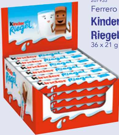
207933 Ferrero Kinder Riegel 36 x 21 g