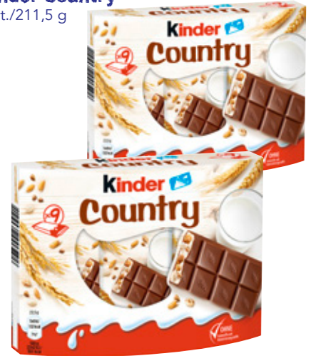
3814 Ferrero Kinder Country 9 St./211,5 g