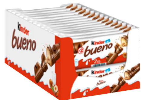
207938 Ferrero Kinder Bueno 2er 30 x 43 g