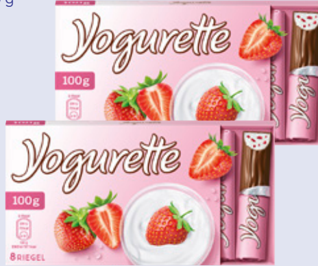
3802 Ferrero Yogurette 100 g