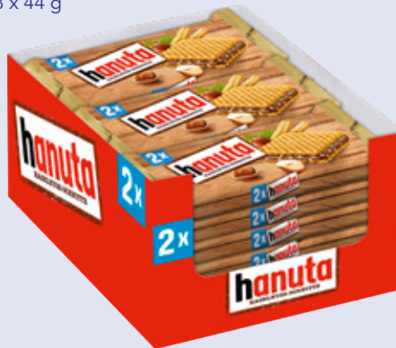
207936 Ferrero Hanuta 2er 18 x 44 g