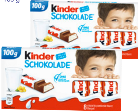
3803 Ferrero Kinder Schokolade 100 g