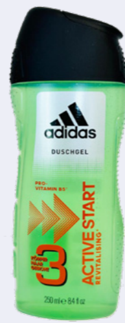
Abb. ggffs. ähnlich

5345, 5348, 5349 Heydt Steinfrucht, Lady Power, Green Power 15%-18% Vol. je 700 ml-Flasche 1 L=9,27