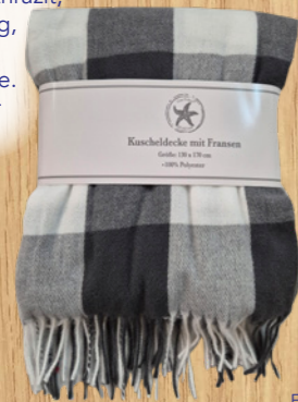
Farb- und Musterbeispiele

7863 Arbeitspullover Gr. M-3XL Marine oder Anthrazit, mit Schulterbesatz, Brusttasche, modern geschnitten, hochwertig verabredet. 70% Polyacryl, 30% Wolle